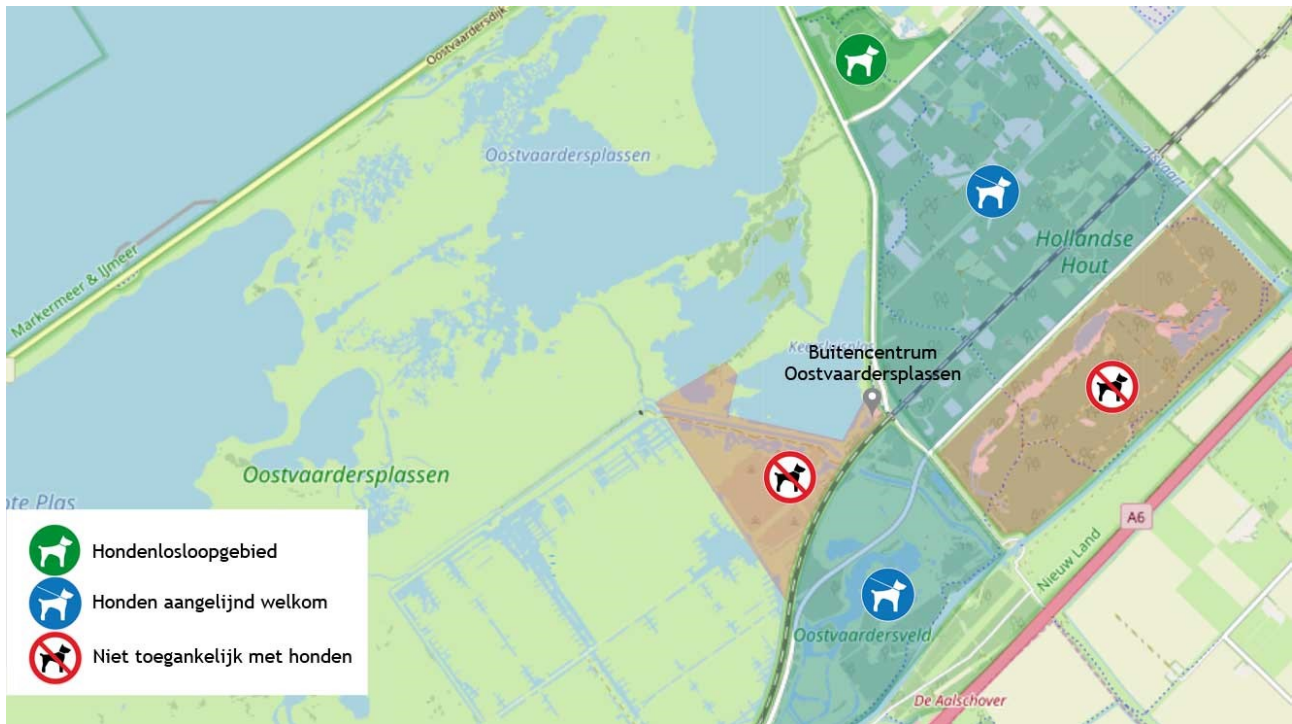
Hollandse Hout, Driehoek en Oostvaardersveld